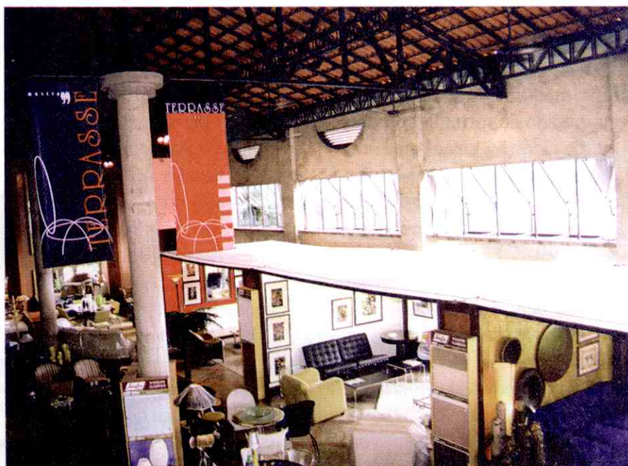
Terrasse: destaque para o talento local.