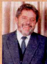
Luis Inácio Lula da Silva Presidente de honra do Partido dos Trabalhadores