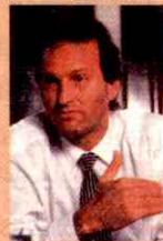
Emerson Kapaz Deputado Federal pelo PSDB